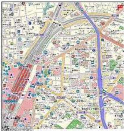
It gives priority to the current state when the drawing and the current state are different.